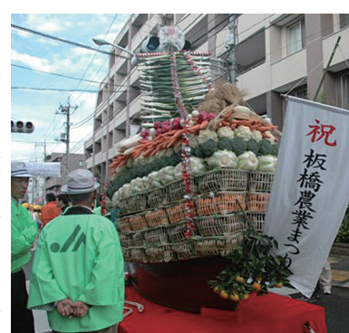
2日目10時から宝船お宝分け抽選券配布と、苗木600本が無料配布されます。けんちゃん汁試食会、農業用機械などの動体展示、風の展示と風作り実演、園芸花木の品評会・展示もあります。