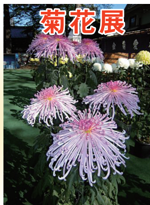
花卉が直線的な管物(くだもの)

11/13(土) 14日 13:00～16:00 10:00～15:30 第33回 板橋農業まつり 区立赤塚体育館周辺4会場